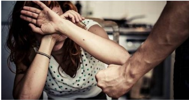
DENIK.CZ Nenech se! Vznikla anonymní síť pro lidi bydlící s násilníky Žij s agresorem, jak s tím ven? Takovou svízelnou otázku si v Čes...

Nenech.se.....bezpečný, zcela anonymní kontakt pro osoby, které zažívají ve svém vztahu násilí fyzické i psychologické a bojí se nebo stydí svěřit. Najděte odvahu a pište. Násilí není Vaše vina.